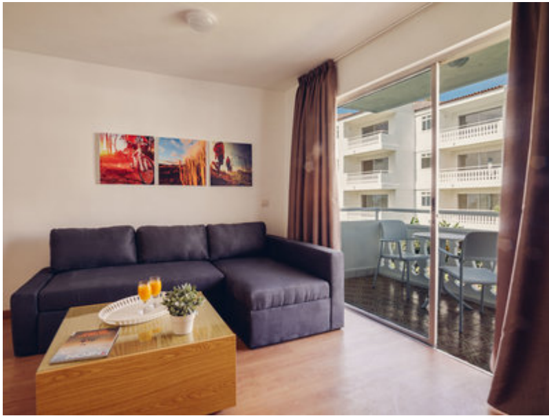
Wohnbeispiel Appartement Standard