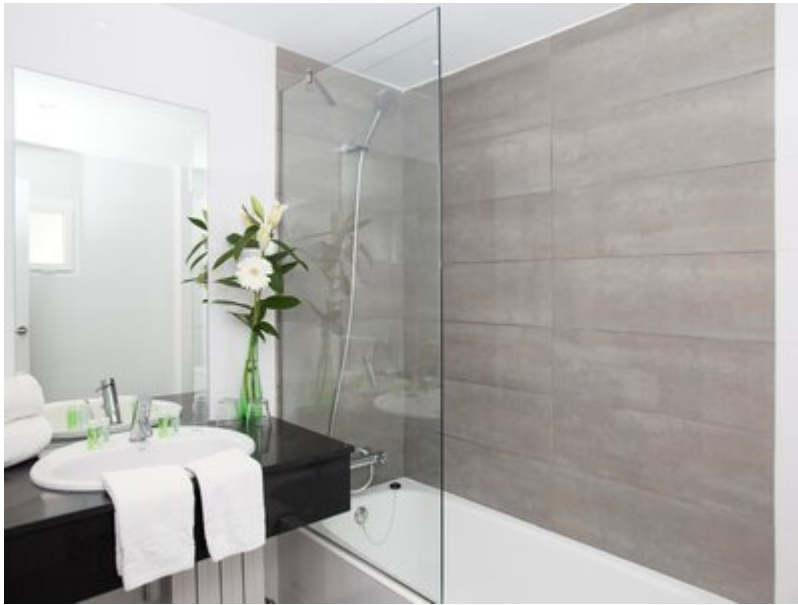
Wohnbeispiel Standard Mountain View